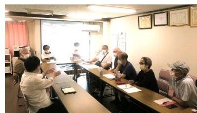
前回の地区集会 於・京都一乗寺コーポラス