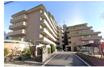
会場・朝日プラザ宇治

年々管理組合の問題が進行しています。高経年マンションになればなるほど多岐に渡って噴出して来ます。どのようにしてより良い方向に向かって進められるのか。共通の問題・個別の問題がありますが『問題の進行』をよりベターな方向にもっていきたいです。各管理組合の問題と取り組み報告をお願いします。