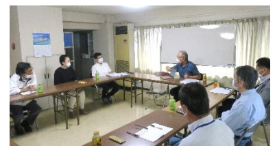
前回の地区集会 於・守山アーバンライフ