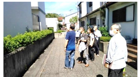
前回の地区集会 大規模修繕工事を実施したタウンハウスの見学 於・西竹の里タウンハウス

洛西地区集会では、会員マンションの高経年化と居住者の高齢化が進んでおり、管理組合運営が課題になっています。すでに常任理事制を採用して管理組合改革を実践している管理組合もあります。11月の地区集会では、個々の管理組合の状況に違いはありますが、高経年化を迎えて、専門性・責任性・継続性をいかに実現していくかについて、話し合っていきたいと考えています。