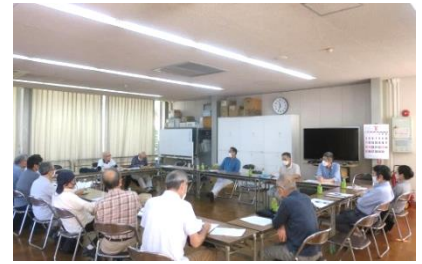
前回の地区集会 於・山科 AB 棟住宅

前回（9/25）と前々回（7/24）は、マンションの苦労話、役員経験談等について、参加マンションからの事前質問も話あって、時間が経つのを忘れる集会でした。今回も期待しています。他地区からの参加と貴重な情報をお待ちしています。