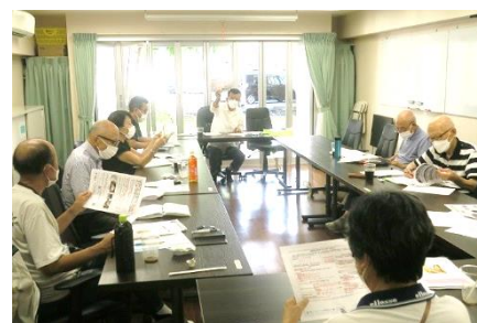
前回の地区集会 於・ルミエール西京極