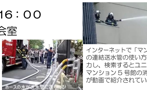
インターネットで「マンションの連結送水管の使い方」と入力し、検索するとユニ宇治川マンション5号館の消防訓練が動画で紹介されています。