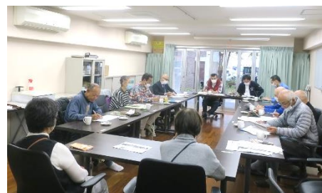
前回の地区集会 於・ルミエール西京極

前回の合同地区集会で積み残しとなった、役員の選出方法、任期、常任理事制への課題などをお話ししましょう。同時に会場の九条住宅は耐震工事を実施したマンションですので見学させていただきます。寒い中での開催ですが、皆様の参加をよろしくお願いいたします。