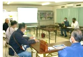
前回の地区集会 於・膳所ハイツ

前回は、大きなテーマである高経年マンションの今後（将来）の方向性について、また、マンション保険の問題点を中心に各マンションの現状報告を行いました。今回は、駐車場や自転車置き場等、利用者の減少に伴う附属施設の維持管理についてお話をします。その他、マンションの抱える問題点や、お話ししたいことがあれば、意見交換をしたいと思います。テーマにこだわらず、ぜひご参加ください。