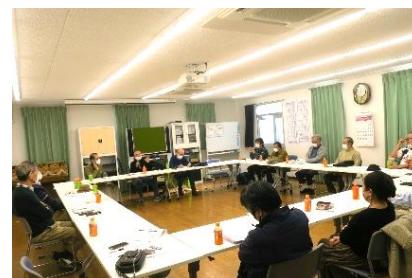
前回の地区集会 於・山科南団地

前回(11月)は、参加者からのいろいろな情報提供を受けました。今回も理事会運営問題や新年度役員選出などの意見交換が主題です。管理組合との交流、運営情報の共有もしたいので、他地区からの参加をお待ちしています。