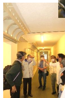
前回の地区集会 於・コープ鴨川A棟