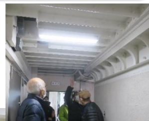
2020年度に耐震改修工事を終えた棟の見学