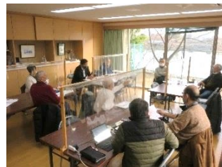
前回の地区集会 於・ユニ宇治川マンション5号館

各組合は多くの悩みを抱えています。役員を選出については常任理事制や輪番制を取り入れている組合もあります。また、居住者の高齢化や単身者への対応のための居住者名簿の充実。管理費委託料の値上げや大規模修繕工事の大幅な価格上昇による管理費や修繕積立金の値上げに対する対応等について意見交換を行いたいと思います。貴重な意見を聞く機会を作りますので多数の参加をお願いします。