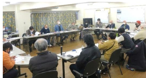
前回の地区集会 於・山科ハイツ

前回は参加者から次々と情報提供を受けました。 今回も活発な意見を期待しています。加えて、今回はマンションの自主管理と委託管理についての集会を予定しています。