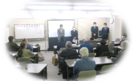
1月15日 第144回改修工事研究会 (高経年マンションのサッシ改修について)

こうして、徐々に管対協の活動も本格化してきましたが、次は、いよいよ今年度最終月の3月の地区集会開催となります。どうか数多くの会員の皆様にご参加いただきますようご案内申し上げます。