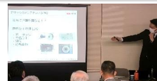
1月15日 改修工事研究会 「高経年マンションのサッシ補修」