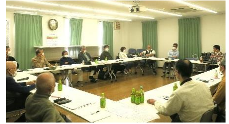
前回の地区集会 於・山科南団地

新年度役員へのアドバイスと前回未審議事項等の意見交換を予定しています。他地区の管理組合の活動情報もお聞きしたいので、他地区からの参加もお待ちしています。