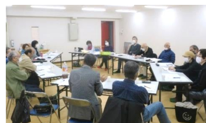
前回の地区集会 於・ハイトピア京町