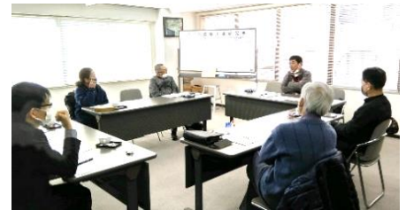
前回の地区集会 於：管対協・MCKセミナーム