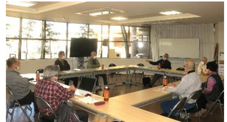
前回の地区集会 於・朝日プラザ