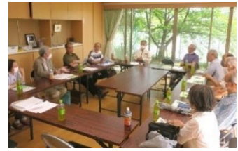
前回の地区集会 於・ユニ宇治川マンション5号館

役員火災(損害)保険の掛け金の大幅な値上げの話を聞きます。各管理組合ではこれから保険会社の選定や契約内容についてどのような考え方をされているのか意見交換をしたいと思います。(各管理組合は現在、どのような内容で保険契約をされているのか契約内容がわかる資料を用意していただけたらと思います)今回は保険の代理店を招き、上手な契約の仕方などの話しをしたいと思います。