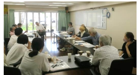
前回の地区集会 於・ルミエール西京極

7月の合同地区集会では、長期修繕計画作成の基本になる修繕、改修工事について学習したいと思います。