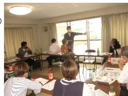
前回の地区集会 於・守山アーバンライフ