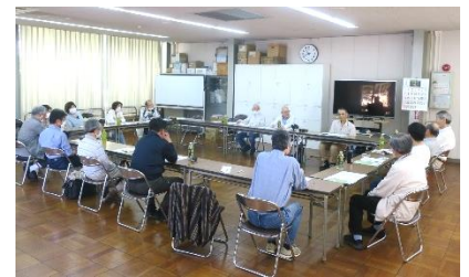
前回の地区集会 於・山科AB棟住宅

新年度役員が出遭った戸惑い、苦労や疑問等を参加で話し合しましょう。質問内容は問いません、質問者が回答者になるような集会にしたいです。今まで同様、時間が経つのを忘れる集會を期待しています。他地区の会員マンションの活動状況も聞かせて下さい。参加をお待ちしています。