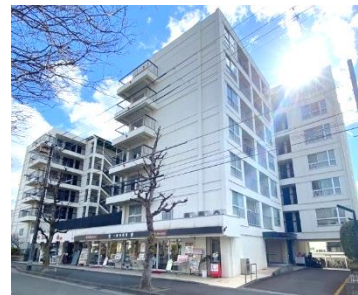
会場の京都一乗寺コーポラス

この地区は、築40年超の高経年マンションが多いのが特徴。そこで、これら高経年マンションに共通する4大事業への取り組みを、各管理組合では、どのように考えられているのかについて、意見交換、情報交換を行なっていく予定です。