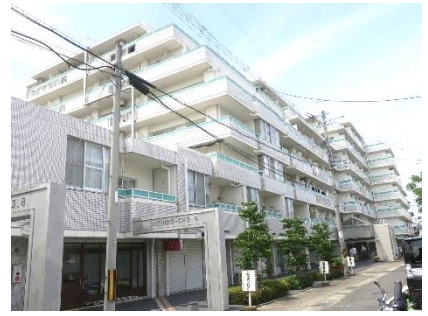
今回の会場・ルミエール西京極

前回の洛西地区集会において、ルミエール西京極管理組合の運営状況や取り組みに学ぶべき点が多いとの指摘があった。それを受けて、それなら、ルミエール西京極へ行って、直接、ルミエールの管理組合から話を聞こうということになり、同マンションでの開催となった。