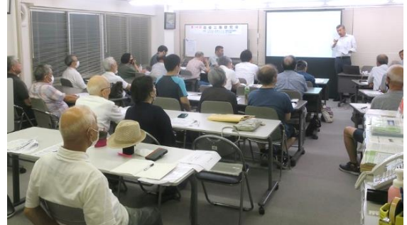
前回の改修工事研究会 7月13日