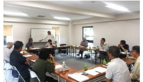
前回の地区集会 於・サンシティ桂坂ロイヤル団地