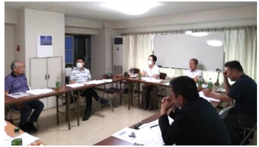
前回の地区集会 於・守山アーバンライフ