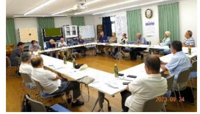
前回の地区集会 於・山科南団地

高経年マンションの運営に求められている「継続性・専門性・責任性」を実践しているマンション、取り組もうとしているマンションの情報や、困りごと、相談ごと、（配管、マンション保険等）も交えた集会所を予定しています。注＝理事会業務引継ぎ書や管理組合の未来ビジョン等を聞きたいです。他地区の活動・運営情報も聞きたいので、他地区の方の参加もお待ちしております。