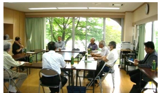
前回の地区集会 於・ユニ宇治川マンション5号館