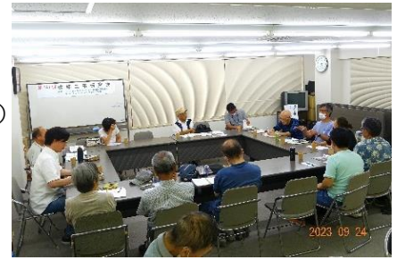
前回の地区集会 於・ルミエール西京極

管理計画認定制度を実際に提出するかどうかは別に して、今回の問題は、各管理組合は自らの管理について考える きっかけになったことは事実だろう。築30年～40年経過して、 自分達のマンションの管理状況は、国が定めた基準に照らして どうなっているのかを知るに良い機会になったと思われる。