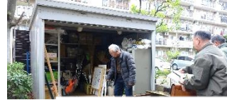
防災倉庫も見学 させていただきました

大きな地震がまた台湾であり、大きな被害が出ています。我々の住んでいる街で何時大きな災害が発生するか解りません。管理組合として建物の耐震に対する取り組みや防災に対する考え方などの話を聞きたいと思います。