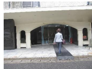
シャトー銀閣の耐震改修工事 2015年耐震改修工事（1期工事）マンション玄関に設けられた鉄骨のアーチ