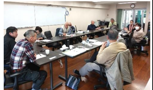
前回の地区集会 於・ルミエール西京極

今回の合同地区集会のテーマはEV電源設置についてです。政府の2035年には自動車生産を100%EV車にとの方針がある中、インフラ整備は遅れ気味、EV車開発も遅延している状況です。しかし、化石燃料から電気エネルギーへの転換は確実にやってきます。パワー世代に対して魅力あるマンションづくりは必須ですので最新のEV事情を専門業者にも参加いただいて学習したいと思います。皆様の参加をお待ちしています。