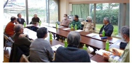
前回の地区集会 於・ユニ宇治川マンション5号館