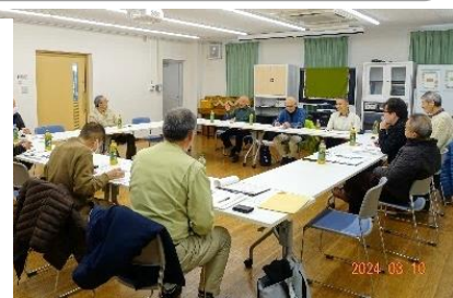
前回の地区集会 於・山科南団地