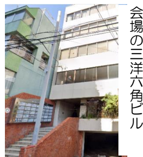
会場の三洋六角ビル

このところの地震の頻発に対応して耐震改修について、各管理組合の取り組み状況などを報告しあいたいと思います。それとともに、これから取り組んでいかななくてはならない設備改修、設備管理についても情報交換を行ないたいと思います。