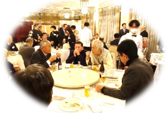
2024年1月の新年賀詞会