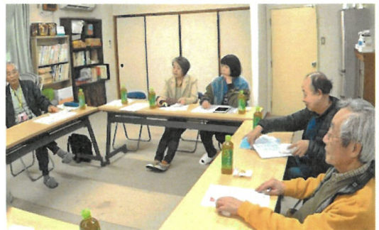
前回の地区集会 於・ユニライフ宇治