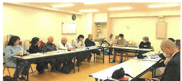
前回の地区集会 於・ハイトピア京町