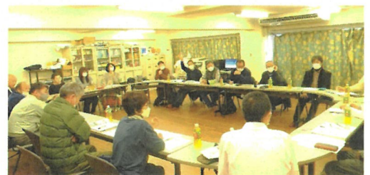
前回の地区集会 於・山科ハイツ

高経年マンションの理事会活動・運営は会員マンションが抱える共通の悩みです。今期の理事会がやり残した継続問題（できなかったこと。あの時このような工夫をしていれば等）を出し合って、新年度理事会に役立つ申し送りできる情報提供の場を予定しています。山科・醍醐地区集会の会員マンションだけでなく他地区会員の方々からの情報提供をお待ちしています。