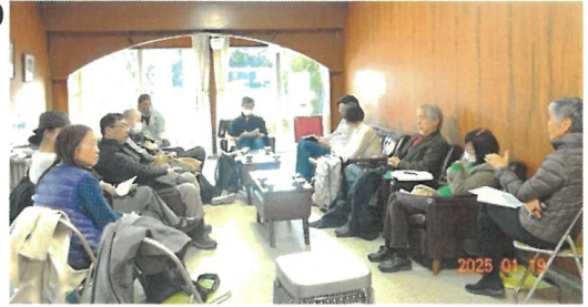
前回の地区集会 於・シャトー銀閣

新年度に向けて各マンションでも修繕計画と共に、役員交代の問題が大きな課題だと思います。理事の高齢化や役員のなり手不足などに困っている組合が多いと思います。新しい理事をどうやって選ぶか、管理組合の継続性をどう維持していくか。各組合の取り組みなどを交流し、どう打開すればいいか話し合いたいと思います。