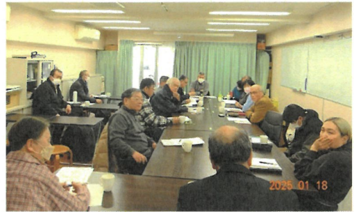
前回の地区集会 於・ルミエール西京極