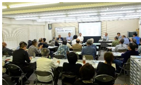
2024年3月2日 「第2回 管理・運営セミナー」