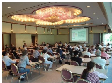
2022年8月7日 「どうする？管理計画認定制度」

マンション管理に必要な知識・技術を得るため、テーマ別に開催されるセミナー・研究会・シンポジウムに参加できます。パートナー企業や一級建築士も参加するので幅広い情報が得られる。