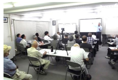
2024年3月21日 第148回改修工事研究会 「大規模修繕、設備改修、耐震改修、サッシ改修をいかに実行していくか」