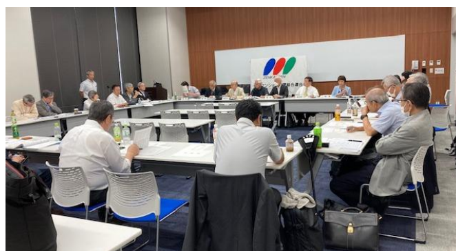
2024年9月24日 全管連通常総会 於・東京都立産業貿易センター浜松町館