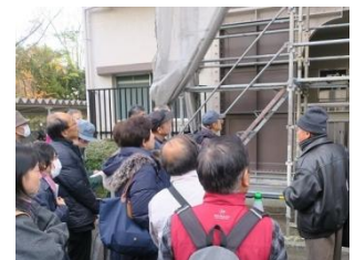
2019年・大規模修繕工事見学会 於・エメラルドマンション膳所