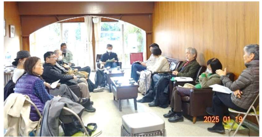
前回の地区集会 於・シャトー銀閣