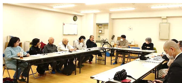
前回の地区集会 於・ハイトピア京町