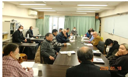
前回の地区集会 於・ルミエール西京極