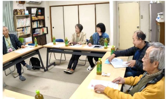
前回の地区集会 於・ユニライフ宇治