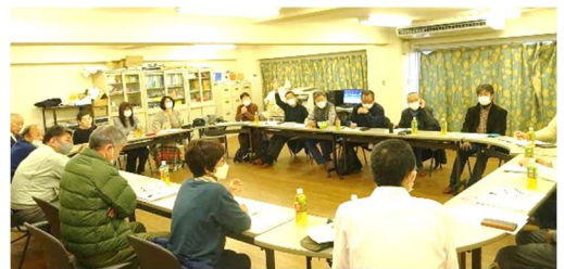
前回の地区集会 於・山科ハイツ