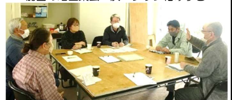
前回の地区集会 於・タウン花みずき