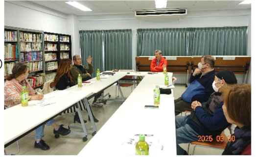
前回の地区集会 於・イトーピア向日マンション

高齢化もトランプショックも待っていても解決しません。一歩前に出るためにみんなで考えましょう。多くの皆さんの参加をお待ちしています。