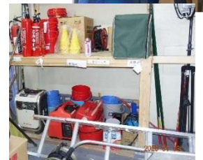
「防災倉庫」山科ハイツ