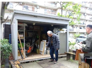
「防災倉庫」 ユニ宇治川マンション5号館