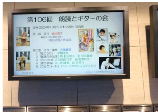
電光掲示板で情報発信(エントランス) ルミエール西京極