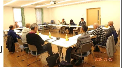
前回の地区集会 於・山科南団地