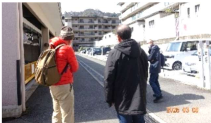
機械式駐車場の見学 サンシティ桂坂ロイヤル団地

地区集会は会員同士の情報交換・意見交換だけではなく、会場マンションの施設もご案内いただくこともあり、会員マンションの取り組みの現場を実際に見ることができる貴重な集会です。昨年度、ご協力いただいたマンションの主な写真です。ありがとうございました。本年度も宜しくお願いいたします。