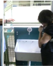
井戸水の活用は災害時の水の確保としても(各階共用廊下に備えられたシンク) ルミエール西京極