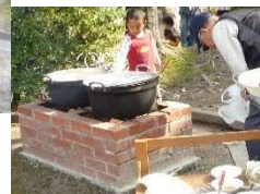
「かまどベンチ」シャルム大津