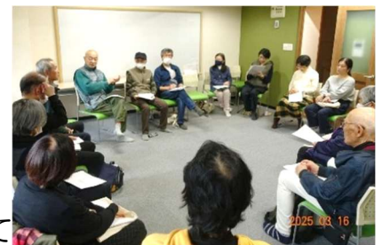
前回の地区集会 於・八瀬鱒乃坊アーバンコンフォ