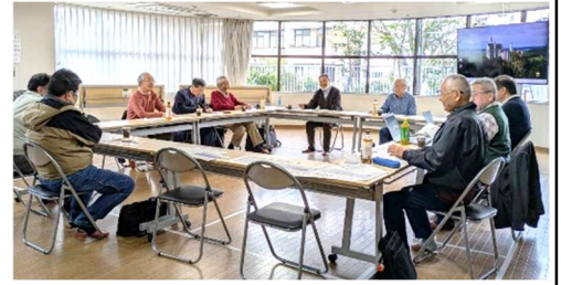
前回の地区集会 於・朝日プラザ宇治

現在、理事の高齢化や役員の成り手不足に困っている組合が多いと思います。輪番理事制と常任理事制をうまく取り入れている管理組合からの報告を聞き、自分たちはどのように対応していけばよいかを話し合いたいと思います。また、各種の委員会を立ち上げている管理組合の話も聞きたいと思います。エイジングコート淀城公園は特別なマンションですが、積極的に理事会運営をされているので参考にしたいと思います。