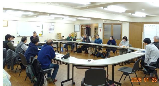
前回の地区集会 於・山科ハイツ