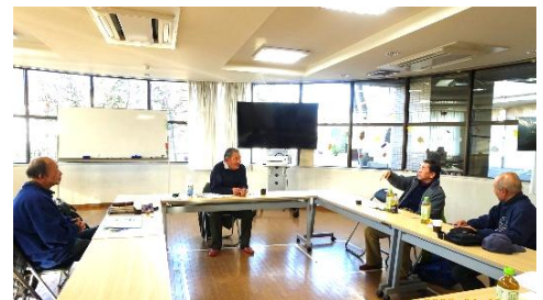
前回の地区集会 於・朝日プラザ宇治