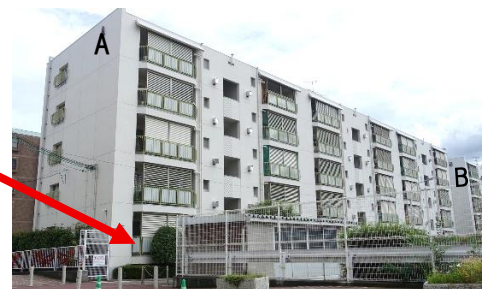
会場のハイム長岡団地