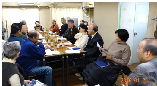
前回の地区集会 於・四条グランドハイツ