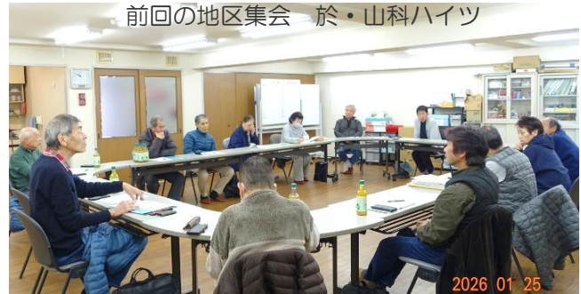
前回の地区集会 於・山科ハイツ

役員不足は多くの管理組合が直面する課題であり、持続可能な運営のためには、無理のない参加の仕組みづくりが不可欠です。皆様のマンションではどのようにして理事を選んでおられますか、実際行っておられる選び方を教えて頂けると助かります。