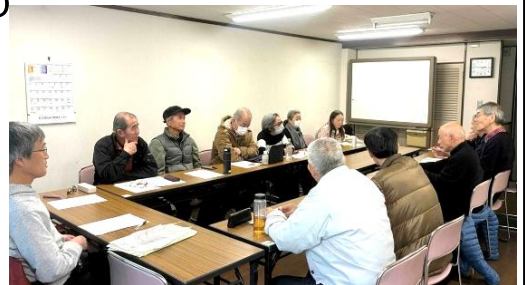
前回の地区集会 於・京都一乗寺コーポラス