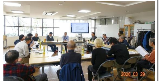
前回の地区集会 於・朝日プラザ宇治

管理組合のマンション関係法が改正されました。これに伴い管理規約の見直しが必要となります。これを機会に自分たちの管理規約の内容について見直し、検討するいい機会にしたいと思います。また、管理規約の見直しばかりでなく管理組合が直面している悩みなど話し合いたいと思います。多数の参加をお待ちしています。