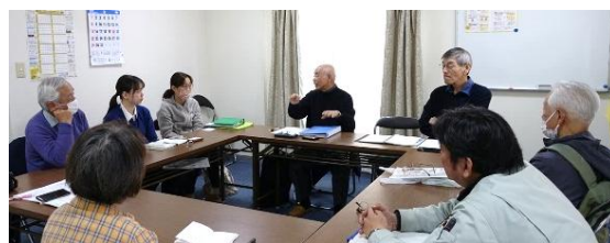
前回の地区集会 於・ハイム長岡団地