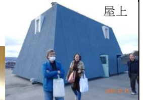
大規模修繕工事を終えたシャトー銀閣を見学