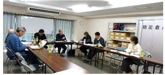
前回の滋賀地区集会 於・ロータリーマンション西大津Ⅱ番館

4月1日より「マンション関係法」が施行され管理組合規約の見直しが必須になっています。皆様のマンションでは管理規約見直し状況は如何でしょうか。