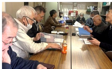
前回の地区集会 於・四条グランドハイツ