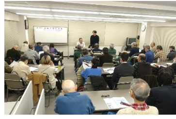
2025年2月20日 第150回改修工事研究会 「テーマ：防水工事の種類と工法」