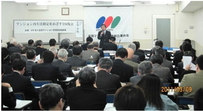
2011年3月9日 マンション再生法制定をめざす全国集会 於・日本教育会館一ツ橋ホール 関係団体や国会議員らも参加し、ストック重視の 理念に賛意を示した

⑥ 政府のマンション政策の展開に伴い、政府関係の委員会・審議会委員も担当しています。