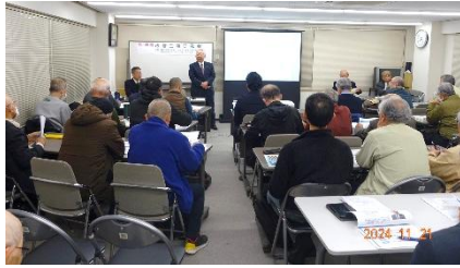
2024年11月21日 第149回改修工事研究会 「未来のマンション計画（永く住み続ける ために）」