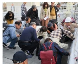
2019年・大規模修繕工事見学会 於・エメラルドマンション膳所