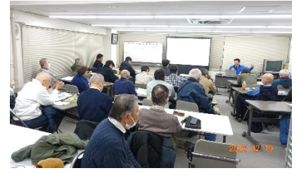
2026年2月19日 第151回改修工事研究会 「テーマ：マンションのLED化」