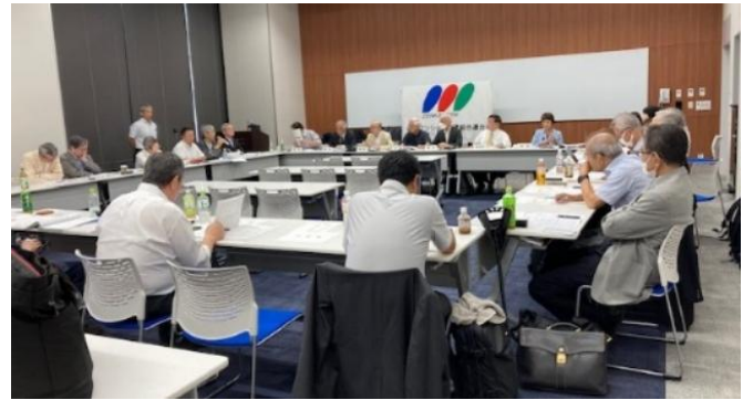
2024年9月24日 全管連通常総会 於・東京都立産業貿易センター浜松町館