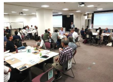
於・ひと・まち交流館京都

参加者を7グループに分け、2つのテーマについて、グループごとに交流を行った。管対協会員がグループ内司会としてグループ内の進行を行った。その後、自由な内容による「ざっくばらん情報交換」を行った後、交流内容を全体で共有した。