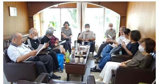
前回の地区集会 於・シャトー銀閣