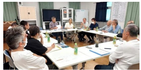
前回の地区集会 於・山科南団地

マンション住民の人口比率の多い団塊の世代が、70歳後半から80歳前半になってきました。今まで団塊の世代は、マンション理事の中心になって元気に活動されてきました。今高齢化になられ、5~10年後に出てくるであろう問題と、その解決法を考えませんか。