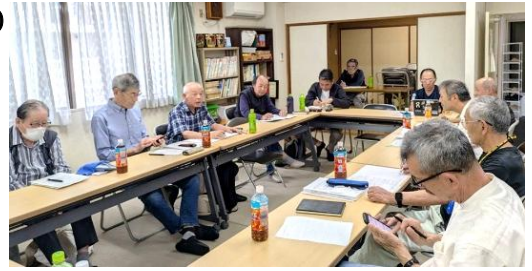
前回の地区集会 於・ユニライフ宇治

それぞれの組合では理事の成り手不足や外部管理者制の導入を勧める管理会社があると聞かれます。また、理事会の運営や総会の進め方についても管理会社任せになっているところも多くなってきました。運営は組合が主導することが望まれます。悩みなど話し合いたいと思います。多数の参加をお待ちしています