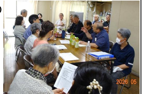
前回の地区集会 於・四条グランドハイツ